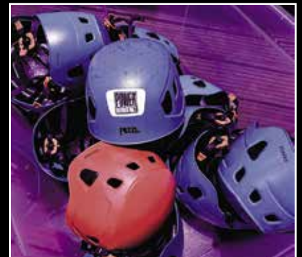
Für alle Teilnehmer besteht selbstverständlich Helmpflicht.