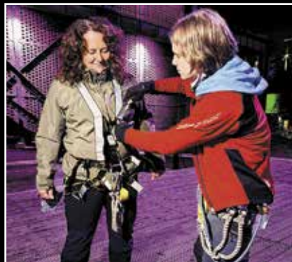
Das A und O: Für die Sicherheit beim Klettern ist gesorgt.