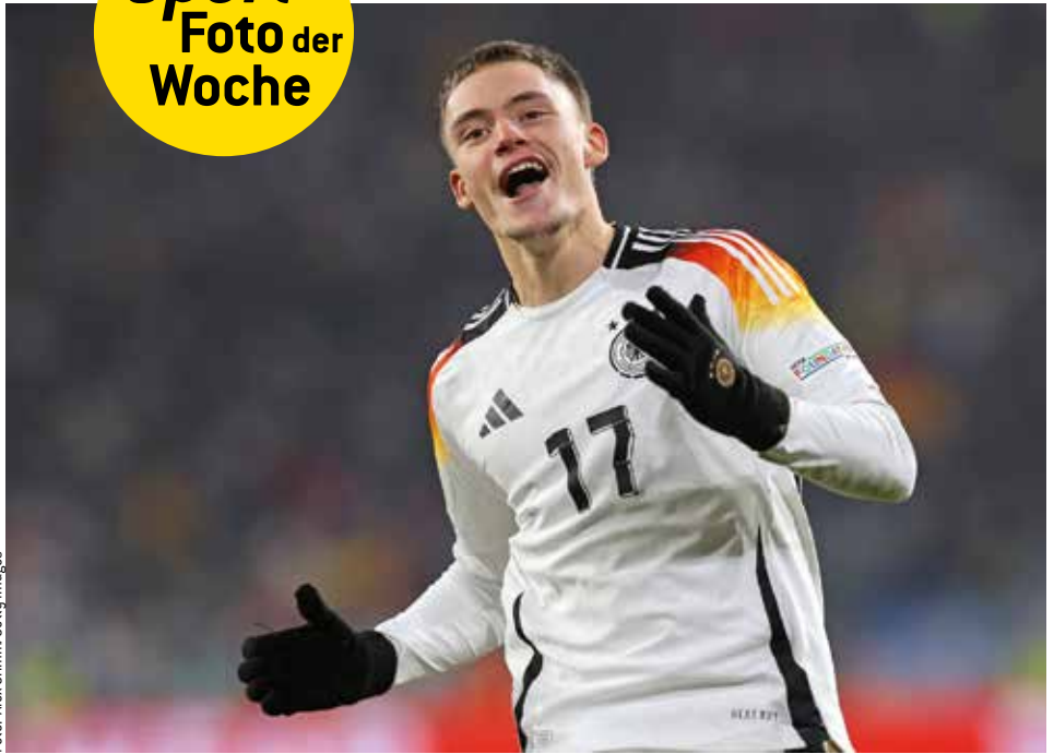
Florian Wirtz freut sich über den von ihm erzielten Treffer zum 4:0 gegen Bosnien-Herzegowina. Das Tor zum 5:0 ging auch auf sein Konto. Insgesamt gewann das deutsche Team mit 7:0.