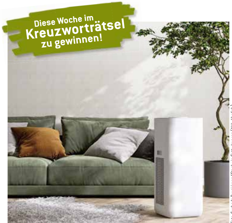
Ein Luftreiniger entfernt Schadstoffe per Staubfilter.

Fische (20.2. - 20.3.) Ein entspannendes Hobby lässt sich intensivieren und es kann Ihnen auch helfen, in Ihre innere Mitte zu gelangen. Glückstag: Freitag