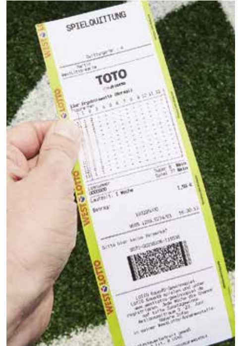
Bei der TOTO 13er Ergebniswette wird mit 1-0-2 markiert, wie die Partien ausgehen.

Über diesen QR-Code kann ein Video aufgerufen werden, das die TOTO 13er Ergebniswette erklärt: