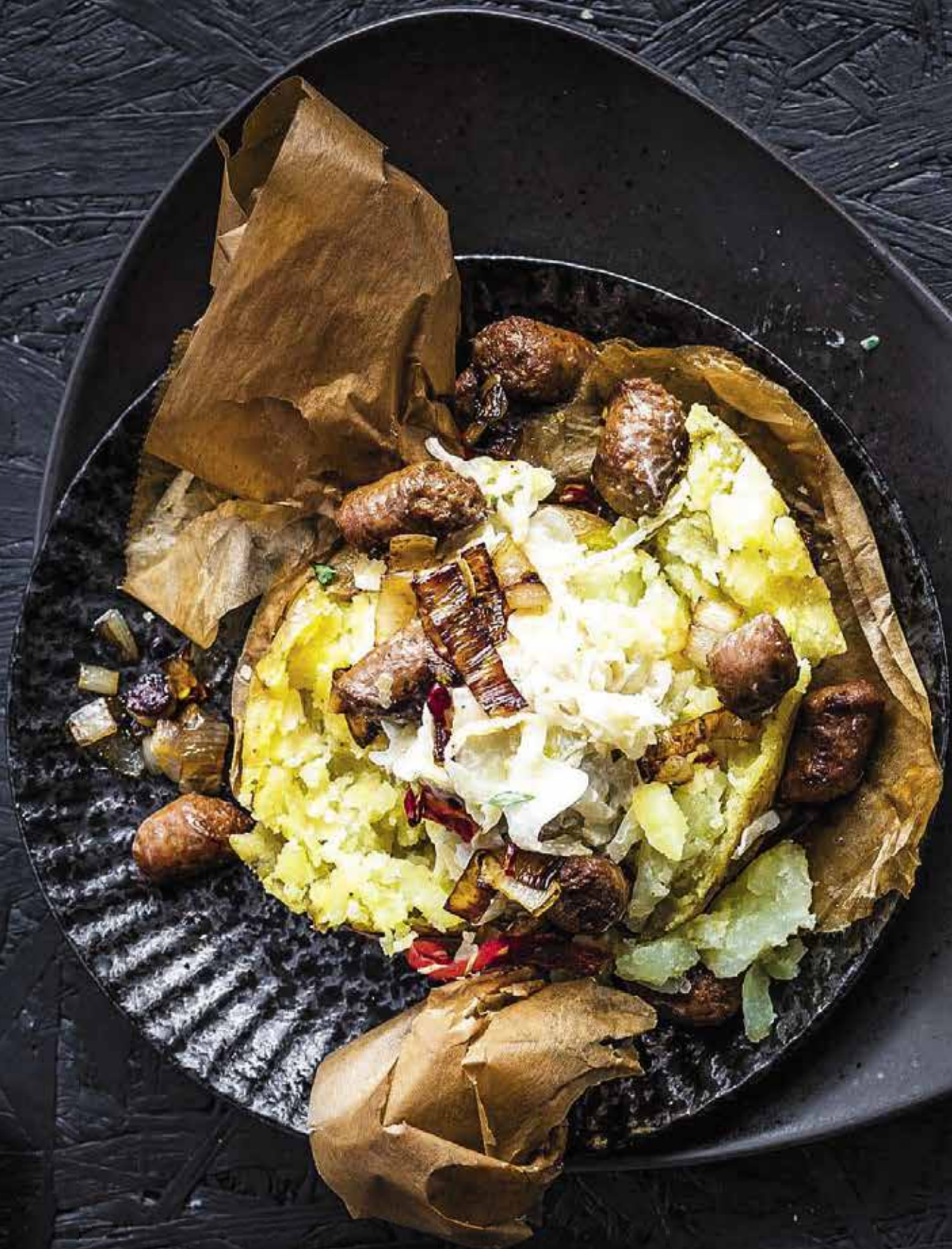
Kumpir ist ein typisches türkisches Streetfood. Mit Merguez und Sauerkraut wird aus der Ofenkartoffel ein würzig-frisches Gericht.