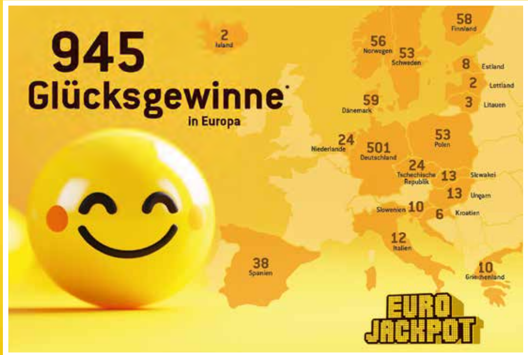
Europa-Vergleich der Hochgewinne ab 100.000 Euro vom 1. Januar bis 31. Dezember 2024.

Als 19. Nation ist Griechenland 2024 zum Kreis der Eurojackpot-Länder dazugestoßen. Am 8. März nahmen die Tipperinnen und Tipper dort erstmals an der Ziehung teil. Inklusiv der griechischen Lotteriegesellschaft OPAP haben sich nun insgesamt 34 staatlich konzessionierte Gesellschaften zusammengeschlossen. Mit Griechenland erreicht die Kooperation jetzt rund 325 Millionen Bürgerinnen und Bürger und ist damit die größte Lotterie in Europa.