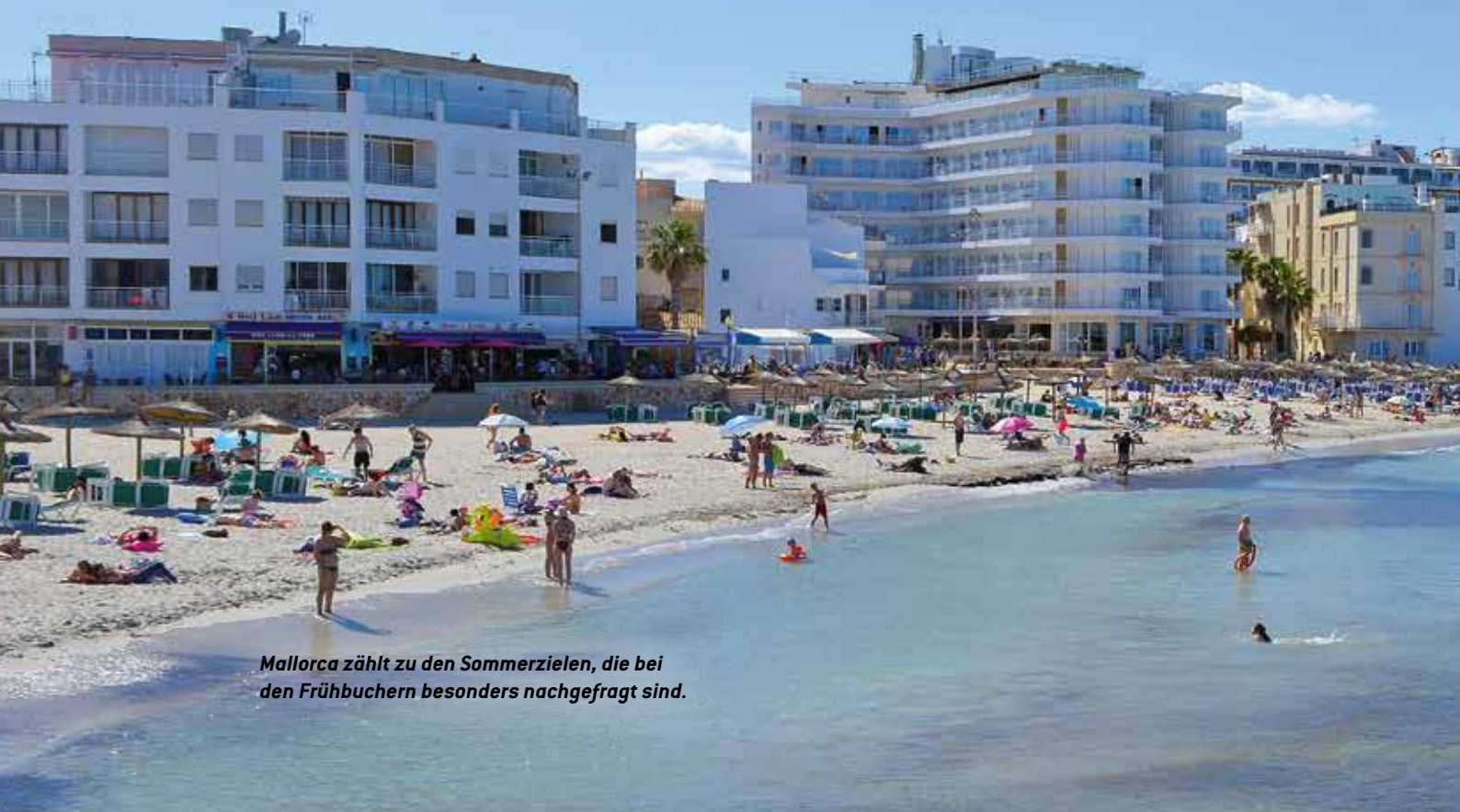
Mallorca zählt zu den Sommerzielen, die bei den Frühbuchern besonders nachgefragt sind.

Verbraucherschützerin Wojtal hält die Portale für nützlich zur Reiseplanung, um das Angebot einzu-