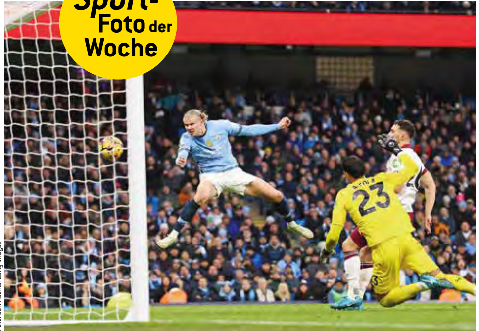
Manchester Citys Erling Haaland erzielt in dieser Szene das zweite Tor für sein Team. Insgesamt steuert er zwei Treffer für den 4:1-Sieg bei.