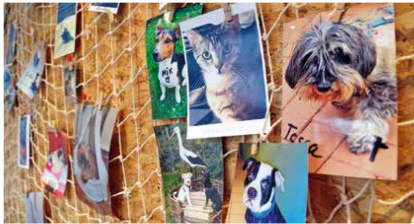
Viele Haustierbesitzer bedanken sich mit Fotos ihrer Lieblinge bei den Tierengeln.