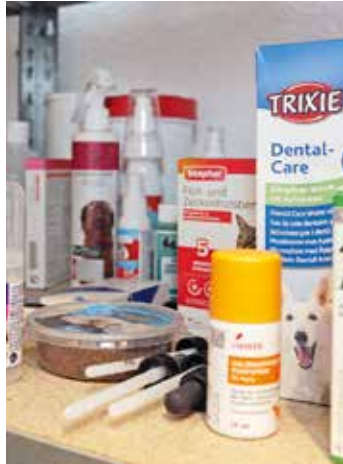
Sonja Fernströning (1.) und Klaudia Hüster kontrollieren regelmäßig den Bestand im Lager.